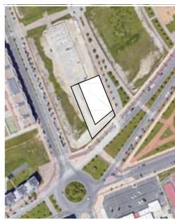
Avenida Reina Sofía COMERCIALIZA: